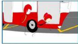
4.- Le retard