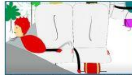
6.- La ceinture de sécurité