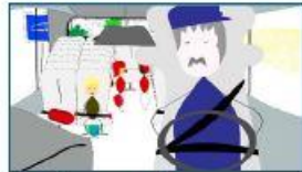
5.- Le respect