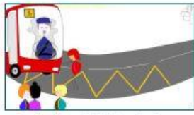
1.- Le jeu à l'attente du car