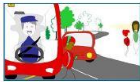
7.- La traversée de la rue