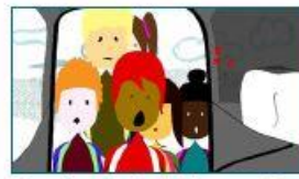
3.- Le chahut à la montée